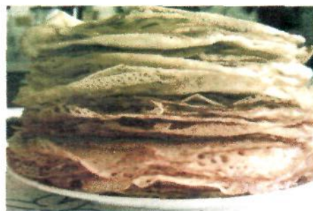
Підготувала Анастасія Дорош

На Масниці весело розважались різними іграми: катанням з гір на санчатах, катанням на «крутилках», на льоду тощо. Частувалися щодня варениками із сиром та сметаною або гречаними млинцями.